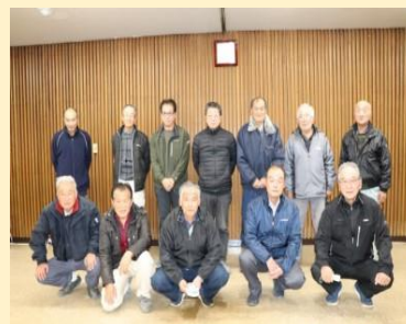
【総会時の集合写真】