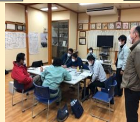
【担い手との個別ヒアリングの様子】