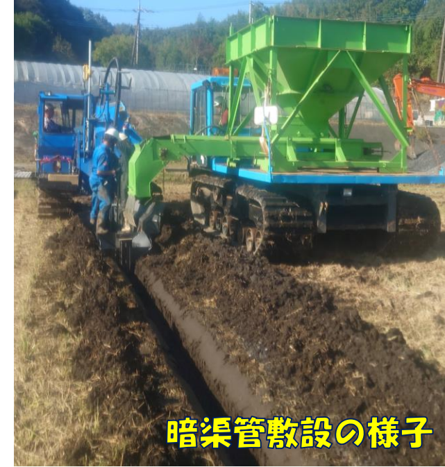
暗渠管敷設の様子