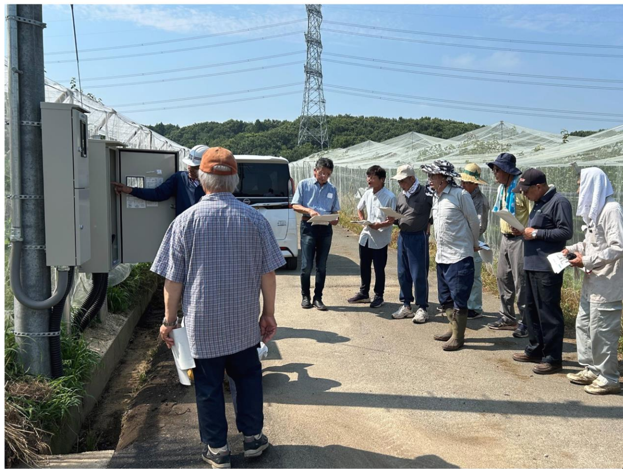
管水路（パイプライン）の操作を説明している様子

管水路工（延長：765 m）の整備が無事完了しました。本整備を通じて、本地区における農業の安定的な展開を図ります。