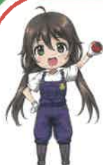
とちぎの農村めぐり 公式キャラクター 村野 めぐ

栃木県では新型コロナウイルス感染防止対策に取り組みながら、社会経済活動の本格展開を図るため、各業界団体と連携した感染防止対策を徹底する取組と、各事業者の参加による感染防止対策の「見える化」の取組を県民運動として展開しています。