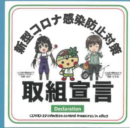
▲取組宣言運動ステッカー

栃木県では新型コロナウイルス感染防止対策に取り組みながら、社会経済活動の本格展開を図るため、各業界団体と連携した感染防止対策を徹底する取組と、各事業者の参加による感染防止対策の「見える化」の取組を県民運動として展開しています。