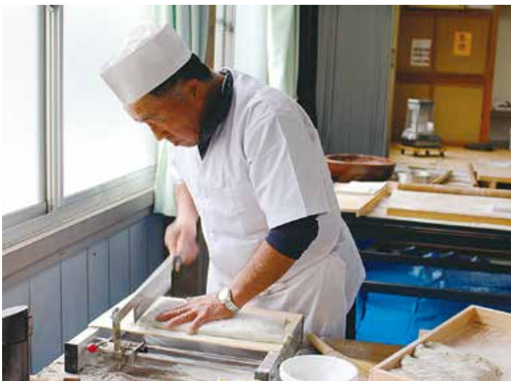
(写真上) おそばは手打ち

そこで、地域の景観維持やその後の作物の利用も考え、休耕農地で菜の花とそばを栽培することにしました。