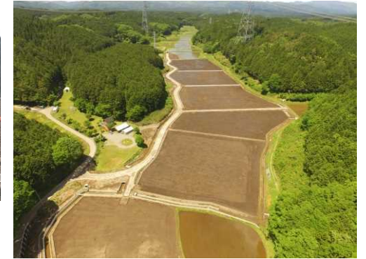
倉掛地区(整備後) 沢幅に広がる整備された農地