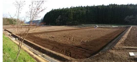
上伊佐野地区(整備後) 大型機械による作業も可能となった