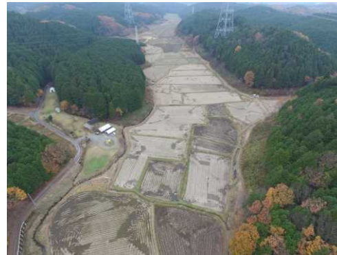
倉掛地区(整備前) 不整形な農地が多い