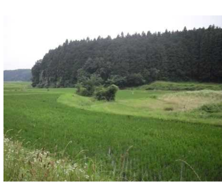
上伊佐野地区(整備前) 耕作されていない農地もあった