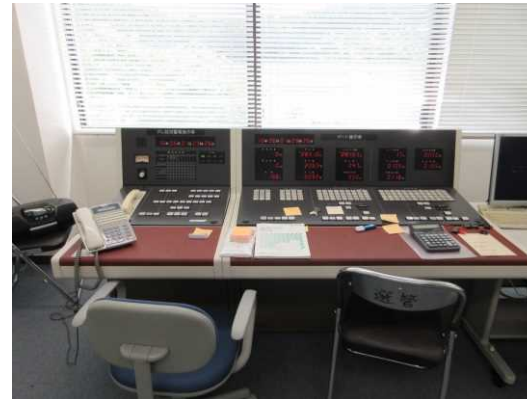
塩田ダム監視・操作室(更新前)