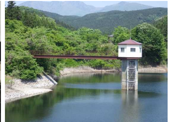
H27取水塔塗装(塗替後)