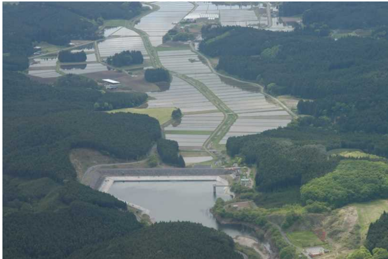
塩田ダムと下流水田地帯