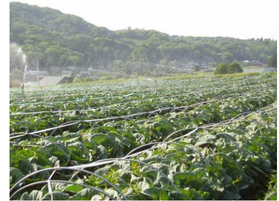
益子町大羽地区・キャベツへの散水