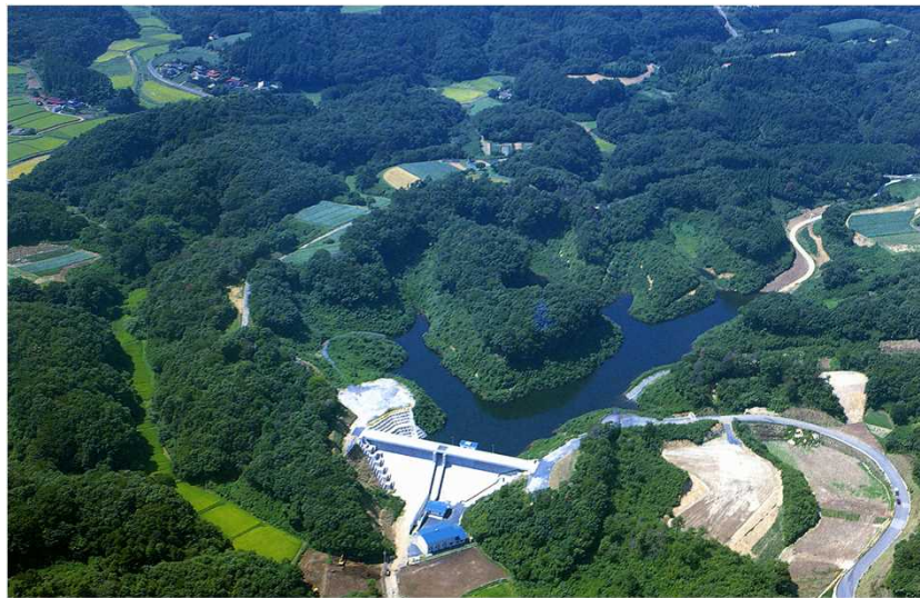
満々と水を湛える管又調整池