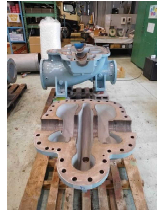
揚水機の分解整備