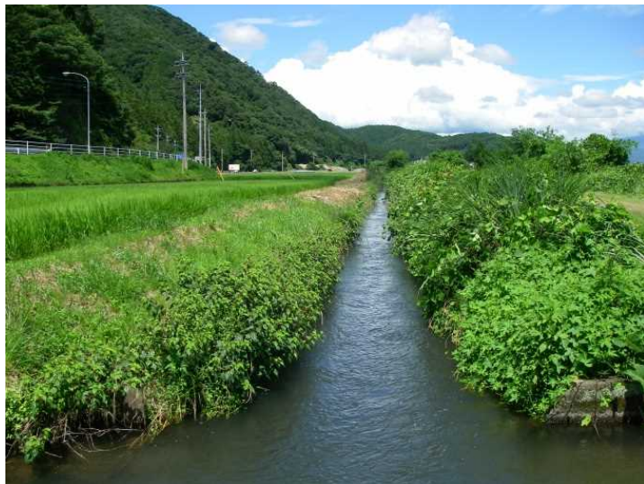
夏、仕事をしている古用水

昭和10年代に建設された古い水路で、水路のあちらこちらで、コンクリートがぼろぼろになっています。 今回は、この老朽化した水路を補修して水路としての寿命を延命します。水路が改修されることで、安定した水を水田に届けることができ、農家が不安なく農業を営めるようになります。