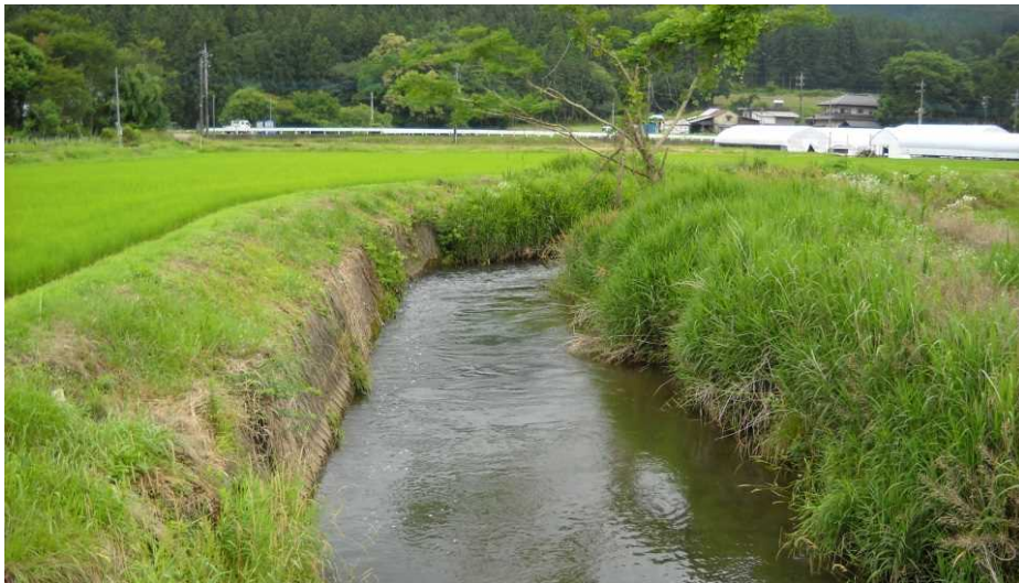
夏にホタルの舞う水路

この地域では今でもホタルが生息し、地域住民にとっては昔から親しんでいる夏の風物詩です。ホタルの舞う、植生の豊かな水辺景観の維持保全に配慮しながら、将来に渡って安定的な農業生産の基盤整備に向け、水田の大区画化・汎用化を進めます。