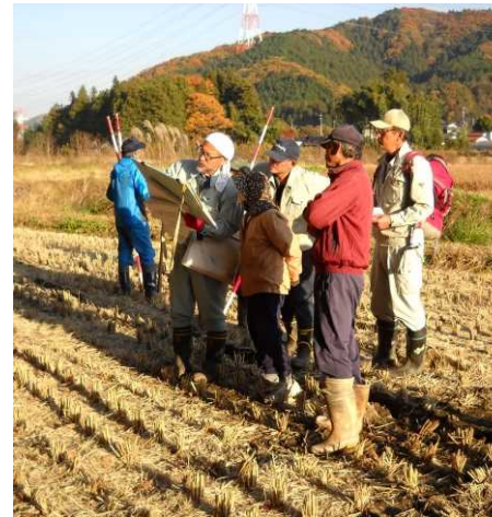
境界立会いの状況