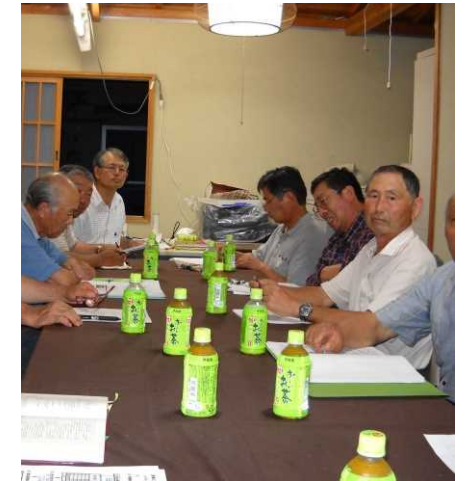
事業推進のための役員会