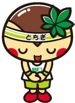
栃木県マスコット とちまる君