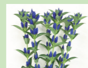
るりおとめ 月あかり (りんどう)