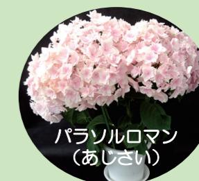
パラソルロマン (あじさい)