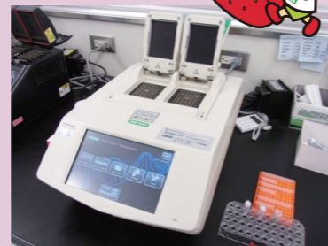
いちご病害の診断