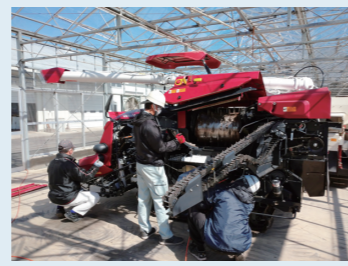
コンバインの分解・清掃