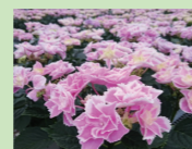
きらきら星 (あじさい)