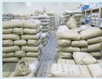
原種等の保管状況