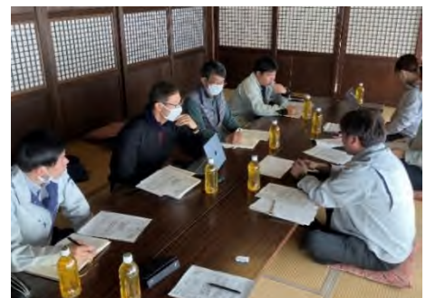
写真1 専門家による助言・指導

名草集落営農組合の組合長と協議を重ね、集落営農組織の課題の洗い出しと法人化に向けた内部での話合いを促しました。その後、農業経営個別相談会や、とちぎ農業経営・就農支