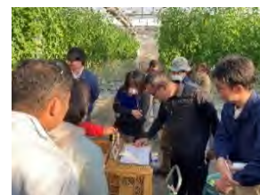
図3 活発な意見交換

スマート農業技術のデータ活用により関心が高まり、下都賀管内のスマート農業機器の導入率は令和3年産で67%から令和7年産で85%となり、導入が進みました。また、減収要因となる果実の裂皮・裂果対策である「果梗捻枝の実施」やコナジラミ類の防除技術としての「天敵の利用」など、実証展示ほを活用した現地検討会を開催したところ、多くの生産者が集まり、活発に意見交換が行われました。特に「果梗捻枝」の実施生産者は年々増加し、裂果・裂皮の軽減に寄与しつつあります。