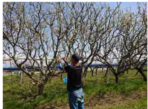
写真1 受粉樹からのなし花粉採取