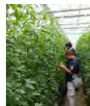
図1 生育調査の実施

部会内での品種比較の検討や今後の管理の目安とするため、定期的な生育調査を実施しました。また、果実品質や管理の状況、病害の発生程度についてもヒアリングし、収集したデータは栽培講習会等の場で共有し、品種ごとの栽培管理の違いなど部会内での理解を深めることができました。