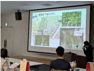
写真1 酪農発表会での講演

飼料用とうもろこし畑における効果的な除草についての調査を行った結果、ドローン空撮画像を活用することで省力的かつ効率的な雑草防除ができることを明らかにしました。また、本取組は、全国青年農業者会議において青少年プロジェクト全国発表を行い、高い評価を受けました。ドローンによる牧草種子の播種技術では、前作の稲WCS収穫が鎮圧を兼ねた作業となり省力化につながることを実証しました。さらに、雑草防除にドローン活用が可能であることを実証しました。なお、これら技術については、家畜市場ワンポイント講座や現地検討会をとおり、畜産農家等に周知を行いました。