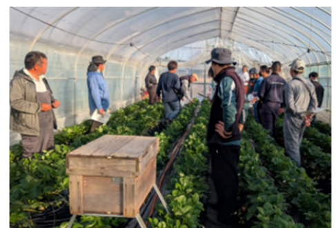
図4 とちあいかの現地検討会

とちあいか導入により単収は向上しましたが、県が取り組む「いちご王国・栃木」戦略の目標である平均単収7tには達していません。また、とちあいかは着色が早いいため、暖候期には過熟や傷みによるロス等が課題となっています。このため、継続してとちあいか栽培技術情報の提供を行い、単収および品質の向上を図ります。