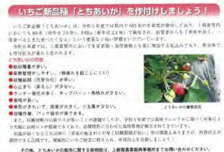
図1 とちあいか作付け推進記事

事務所発行の「認定農業者だより」とJA広報誌を活用して、とちあいかの作付け拡大を周知しました。また、上都賀農協いちご部各支部の現地検討会で作付け推進を図りました。さらに、新規栽培者への個別巡回指導や全戸糖度調査を実施し、「とちあいか」栽培定着や品質向上にも取り組みました。