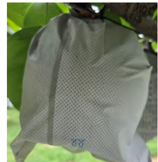
写真3 遮熱性果実袋の検証

また、高温対策には、樹勢強化やかん水等の管理作業も重要であることが認識され、取組が進みつつあります。