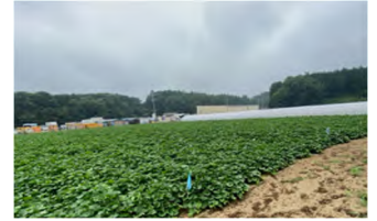
写真 展示ほの様子

試験の結果は栽培講習会や土壌診断説明会等で生産者に周知し、適正施肥、適期防除の重要性について指導しました。