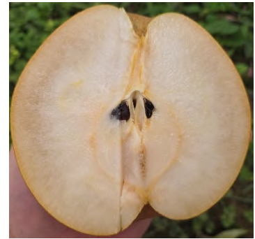
写真2 高温による果肉障害

また、令和6年度から展示ほ等を設置し、合成繊維果実袋や遮熱性果実袋の新たな資材等の効果検証に取り組みました。