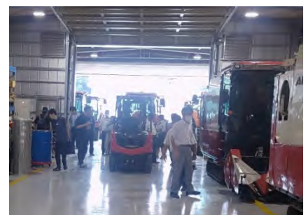
写真2 研究会での先進事例調査

小山市のすべての地域計画地区（15地区）において、耕作者の営農意向などの情報を収集・整理し、担い手不足が顕著な地区を特定しました。