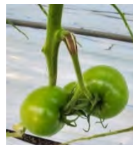
図2 果梗捻枝の処理後

気温上昇の影響によって、果実の着果不良や年内の収穫時期に発生する裂皮・裂果が課題となっています。そのため、果実に繋がる茎（果梗）を潰して、水分流入を阻止する「果梗捻枝」という技術に取り組み、裂皮・裂果の発生程度について調査を実施しました。