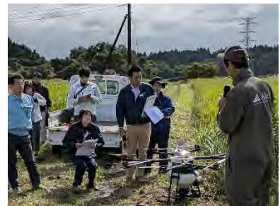
写真3 ドローン播種検討会