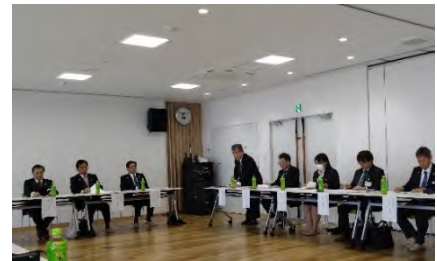
写真1 研究会発足式

JAおやまは、地域農業の持続に向けてJA出資型法人の設立を目指す方針を明確にしました。これを受け、令和7年10月に、JAおやまと小山市、下野市、野木町による「JA等出資型法人設立準備会」が発足しました。