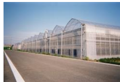
低コスト耐候性ハウス