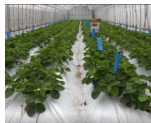
四季成り性いちご品種 (写真は「なつおとめ」)