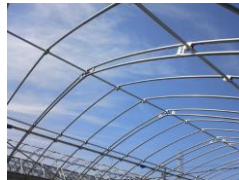
ダブルアーチによる補強