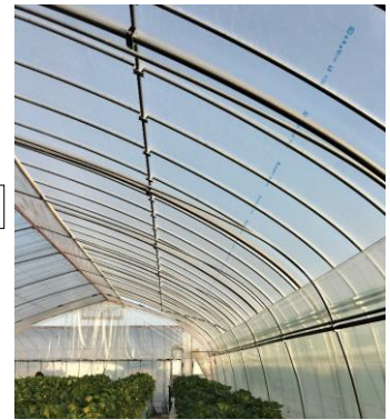
単管パイプによる補強