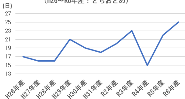
県いちご研究所の花芽分化日（9月）の年次推移 （H26～R6年産：とちおとめ）

いちごでは、高温による花芽分化の遅延や病害虫の多発、大雨によるほ場の浸水、台風や突風による施設被害の増加などのほか、大雪の頻度が増加すると言われており、強風や大雪に備えた設備やハウスの強靱化等が必要になると予測されます。