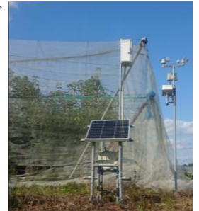
図 なし園に設置された気象モニタリング機器 （通信機能付き）