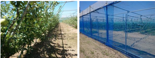
図 左：りんごのジョイント仕立て栽培 右：りんご防風ネットの設置