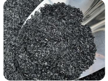
バイオ炭（もみ殻くん炭）