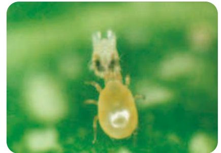
ハダニを捕食する天敵