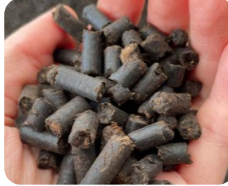
ペレット化した堆肥