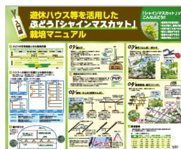
写真3 栽培マニュアル