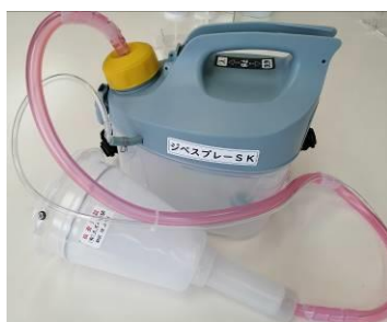
写真2 G A 処理機