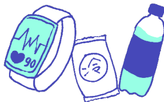
ウェアラブル端末、 応急セット