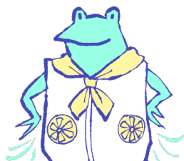
ファン付きウェア、 ネッククーラー