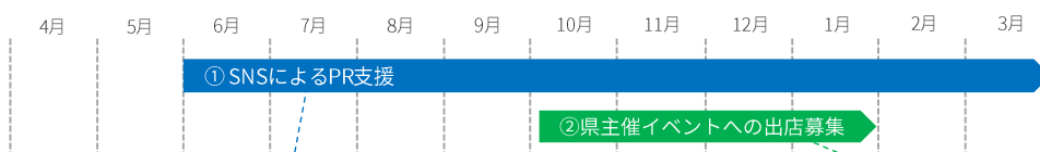
情報提供スケジュールイメージ

「いちご王国」公式SNSを通して、協賛事業者様をPRします。 PR内容の募集等のやりとりをslackで行う予定です。