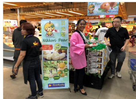
現地プロモーション（梨）