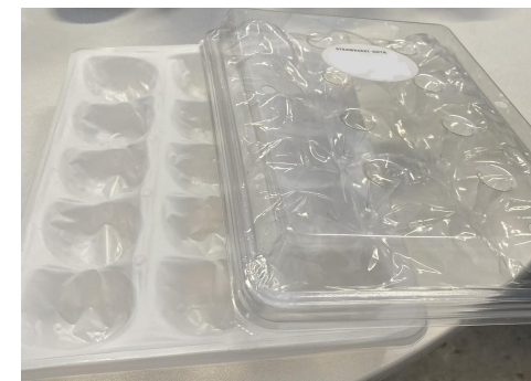
品質保持のための輸送資材（いちご）