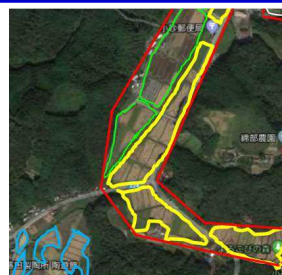
小砂地区における協定の連携 黄枠:小砂渡戸集落 青枠:小砂トゲの草集落 緑枠:周辺の協定集落 赤枠:こいさご集落営農組合