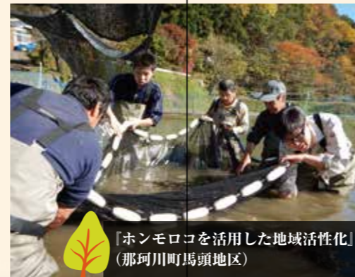
「ホンモロコを活用した地域活性化」 （那珂川町馬頭地区）

地域の特性に応じた多様な地域住民活動の展開を図るため、ワークショップの手法を用いて、地域住民活動の活発化や組織作り等を支援しています。