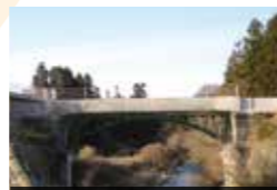
「県営中山間地域総合整備事業」