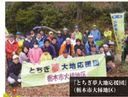
「とちぎ夢大地応援団」 （栃木市大柿地区）