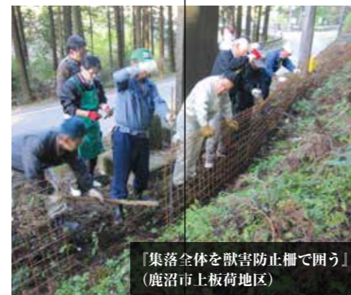
「集落全体を獣害防止柵で囲う」 （鹿沼市上板荷地区）

鳥獣類による農作物被害を防止するため、地域が主体となって行う総合的な鳥獣被害防止の取組を支援しています。