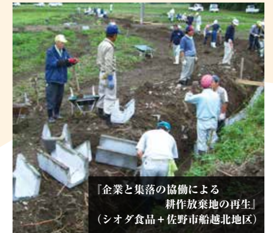
「企業と集落の協働による耕作放棄地の再生」 （シオダ食品+佐野市船越北地区）

企業等と中山間集落の協働による耕作放棄地の再生・利活用に向けた活動を支援しています。