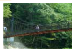
「山村振興対策事業」