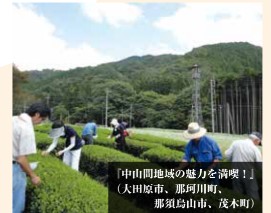
「中山間地域の魅力を満喫！」 （大田原市、那珂川町、那須烏山市、茂木町）

農山村地域の魅力を体験できるツアーや若者の視点による課題解決の取組等を通じて、中山間地域のファンづくりを支援しています。