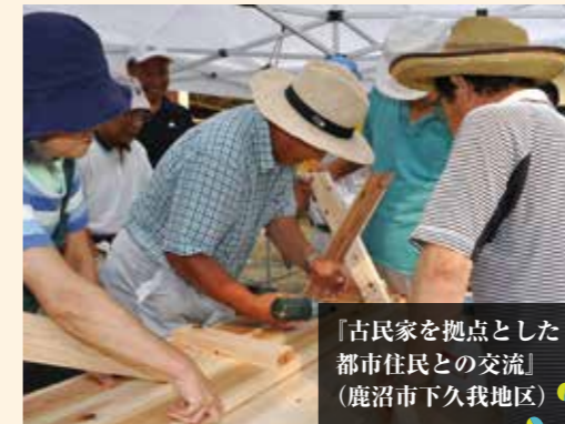
「古民家を拠点とした都市住民との交流」 （鹿沼市下久我地区）