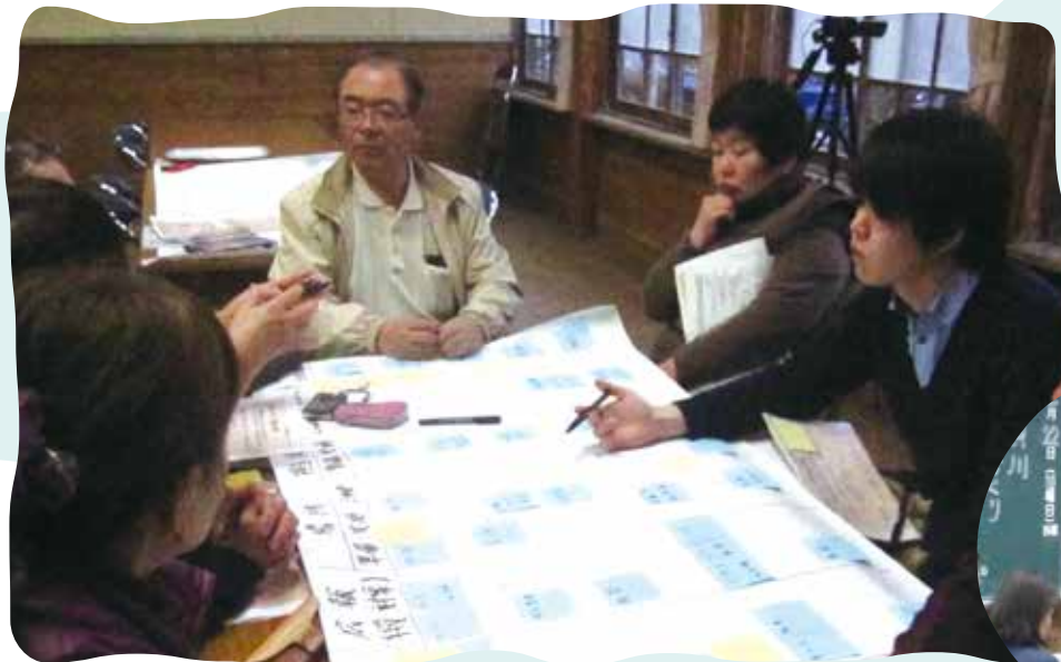
集落の課題を解決するための「地域活性化案」を若者の皆さんの視点で提案してもらいます。

中山間地域の多くの集落では高齢化や過疎化の進行等により、農業や地域活動が困難な状況となっています。その中で、「地域を活性化し、元気にしたい」と頑張っている集落もあります。こうした集落に実際に訪れてもらい、1人でも多くの方に中山間地域のファンになって頂けることを期待しています。