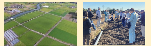
作業効率が良い、整備された水田

農地や農業水利施設などの農業生産基盤の整備や管理により、良好な営農条件を備えた優良農地を確保するとともに、農村地域の防災・減災力の強化と安全性に配慮した次世代型の農村環境の整備に取り組みなど、安全・安心で住みよい農村づくりを進めます。