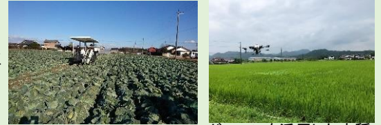
キャベツの機械収穫

水田を活用した競争力の高い大規模園芸産地の育成を進めるとともに、先端技術の導入や団地化を進め、省力的で効率的な稲・麦・大豆の生産体制を確立します。