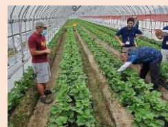
ベテラン農家「とちぎ農業マイスター」による新規就農者指導