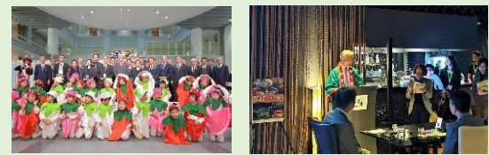
県誕生150年記念「いちご王国・栃木の日」イベント

「いちご王国・栃木」を最大限に生かしてブランド発信力を強化するとともに、オリジナル品種のブランド価値の深化を図り、国内外で「選ばれる栃木の農産物」の実現を目指します。