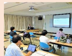
農業法人等の雇用管理能力向上研修会