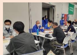
就農相談会の開催

産地が主体となった新規参入者を受け入れる新たな体制づくりを進めるとともに、農業を学ぶ機会の充実を図り、栃木で農業に取り組む多様な人材の確保・育成を進めます。