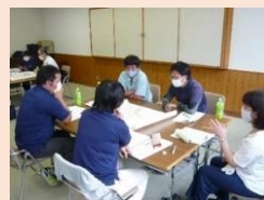
集落営農組織の連携に向けた話し合い

高齢化などにより農家が減少する中、地域農業を持続的に支えていくため、担い手への一層の農地集積・集約や、広域的に営農を展開する法人などの新たな担い手の育成を図るとともに、多様な人材など地域の力を結集した農業の仕組みづくりを進めます。