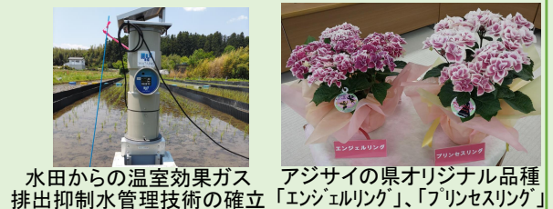
水田からの温室効果ガス排出抑制水管理技術の確立

本県農業の顔となるオリジナル品種や生産性の高い新技術の開発を進めるとともに、気候変動や温室効果ガス排出削減など環境の変化や時代のニーズに適応した農業技術の開発・普及により、本県農業のイノベーションを促進します。