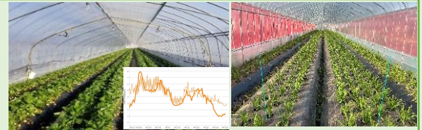
AI活用によるいちご生産システムの開発

A I等を活用した新たないちご生産技術の開発や、いちご、にらの高収益モデルの確立等により、施設園芸の収量や品質の飛躍的な向上を図ります。