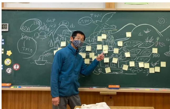
特別授業「サシバの里を守るには」