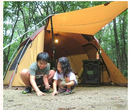
とちぎの農村#フォトコンテスト優秀作品