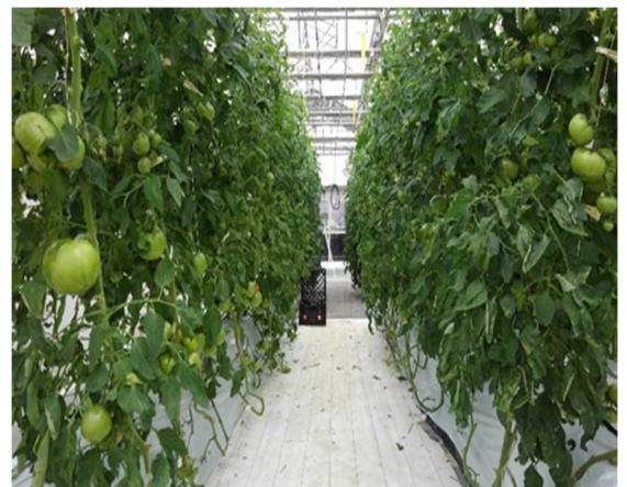
写真1 トマト 50 t 実証の様子