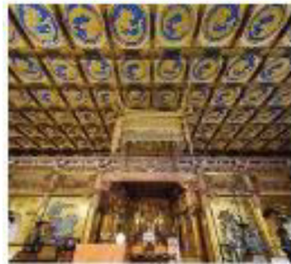
④天井絵（輪王寺大猷院）