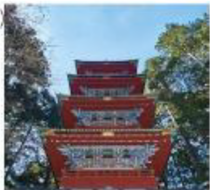
③五重塔（日光東照宮）