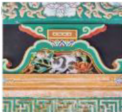
②眠り猫（日光東照宮）