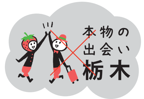
他の図形を組み合わせる