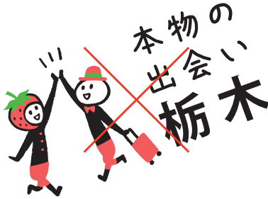
斜め配置/回転配置