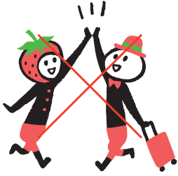
イラスト単独利用