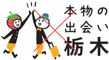
指定色以外の使用