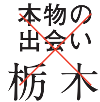
フォントやサイズの変更