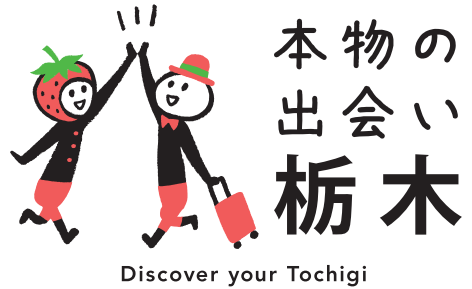
基本形② (英語表記つき) PTN_A_2