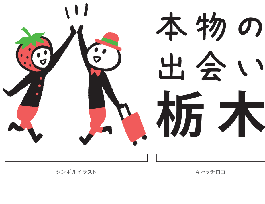
シンボルイラスト

シンボルイラストは、栃木県を代表する「いちご」と県内各地を訪れた人がハイタッチする場面によって本県には「本物の出会い」と呼べる、その人ならではの素敵な出会いが待っていることを表現しました。