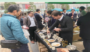
フランス・ヴォークリューズ県友好交流