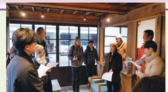
外国人観光客向けモデルツアー