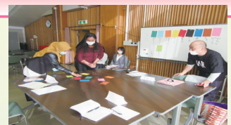
日本語学習支援者を対象とした研修会