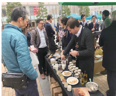
フランス・ヴォークリューズ県友好交流