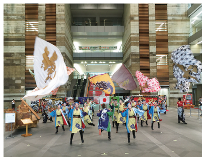
栃木県インディアナ州オンラインよさこいフェスティバル