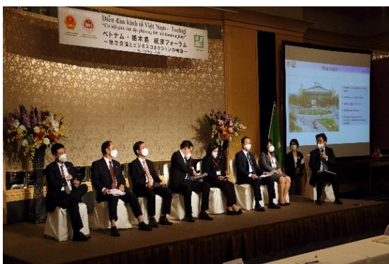
▲経済フォーラムの様子