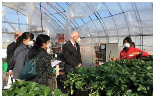
▲農業大学校視察（いちご栽培の説明）