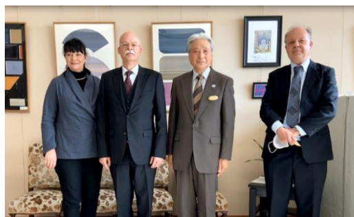
▲(左から2番目)クレメンス・フォン・ゲツェ大使