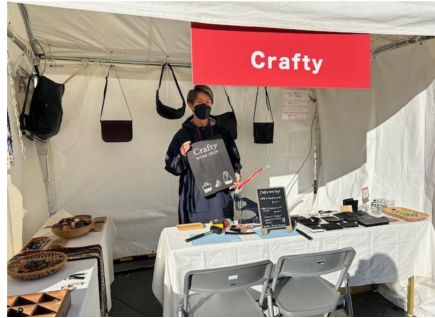
C r a f t y