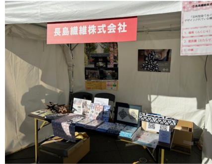
長島繊維株式会社