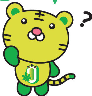
とちぎカーボンニュートラル実現リーダー ニュートラくん