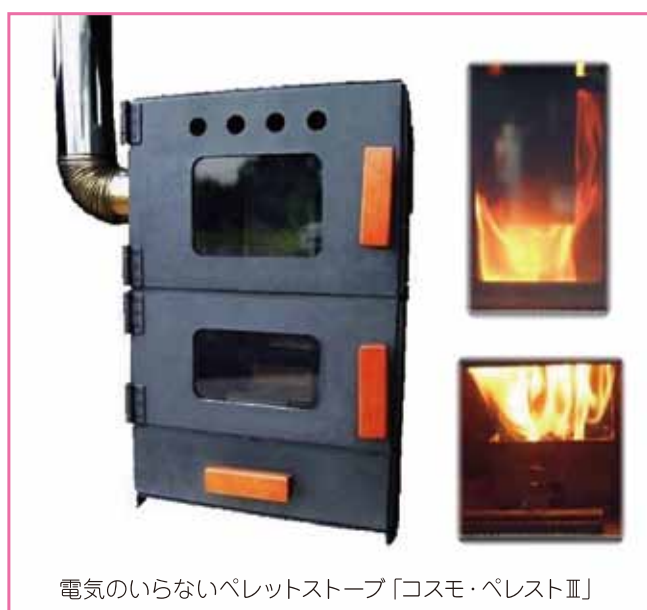
電気のいらないペレットストーブ「コスモ・ペレストⅢ」