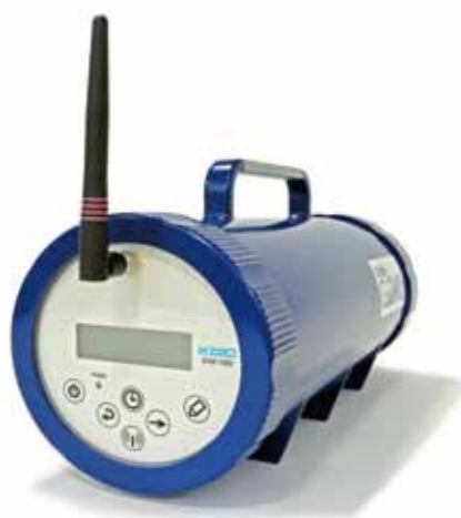
携帯型環境放射線測定器 Mobile G-DAQ (モバイル ジーダック)