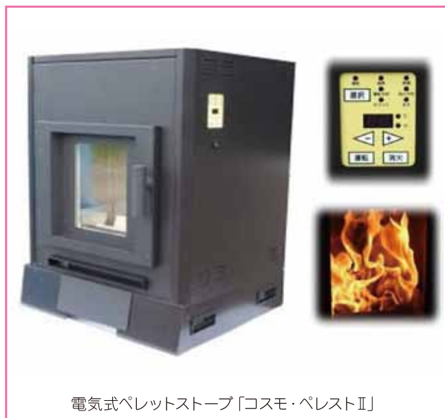
電気式ペレットストーブ「コスモ・ペレストⅡ」