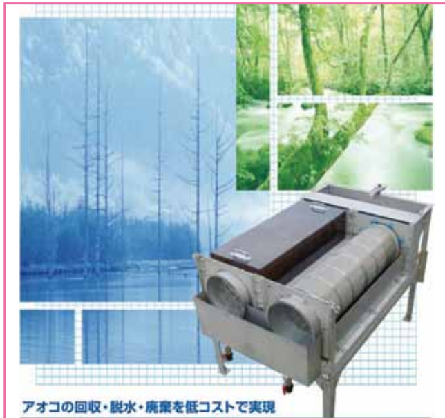
アオコの回収・脱水・廃棄を低コストで実現