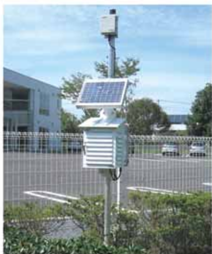
ネットワーク型環境放射線モニタリングシステム G-DAQ(ジーダック)