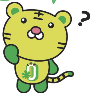
とちぎカーボンニュートラル実現リーダー ニュートラくん