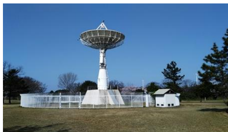
国立天文台パラボラアンテナメンテナンス

モーターの修理・メンテナンスは、現地を訪問し点検整備の実施もしております。モーターが設置されている設備の状況を把握して、適切なメンテナンス作業も行いながら設備の維持管理の手助けをさせて頂いております。