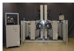
コイル自動成型機

わが社の《新幹線等の鉄道車両用・圧延機等の産業用の中型モーター用コイル全自動製造装置》にはこんな特徴があります！