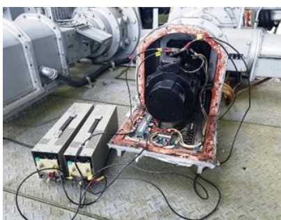
垂直方向駆動用モーター