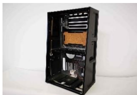
アミューズメント筐体