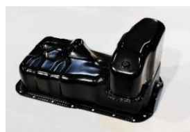
自動車オイルパン

他にもここには載せきれない設備と製品群がございます!! ぜひ、一度工場見学からでもお声掛けください!