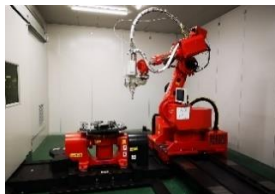
ファイバーレーザー溶接機