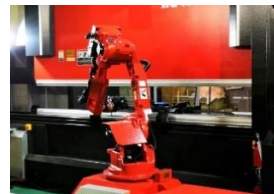
ATC付ロボットベンダー