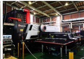
パンチレーザー複合機