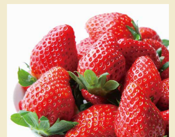
栃木のいちご「とちおとめ」