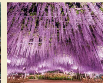
「あしかがフラワーパーク」