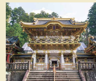
世界遺産「日光東照宮」