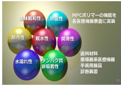
MPCポリマーコーティング