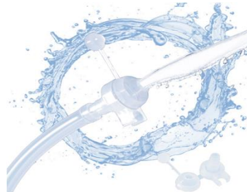
再使用可能な 汎用吸引チップ