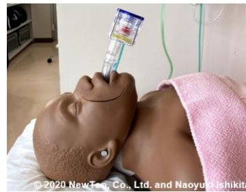
単回使用 ガス式肺人工蘇生器