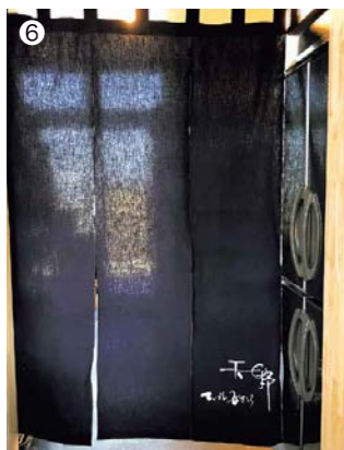
① 益子焼の食器 ②④⑤ 鹿沼組子や烏山手すき和紙をあしらった食器棚と引き戸 ③ 烏山手すき和紙を使用したメニュー表 ⑥ 益子草木染の暖簾