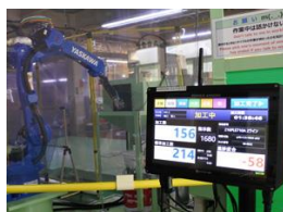
製品名: パワーあんどん

実績収集・生産設備の稼働監視 パワーあんどん 生産ラインの効率を上げることを目的として、タッチパネル装置を生産設備に接続することにより、各生産設備の生産指示をもとに生産状況、生産出来高や不良の情報をリアルタイムに収集し、工場内大型掲示板や管理者パソコンにて現場の今を把握することができる。また、収集したデータを集計して各生産設備毎の稼働実績や日報、不良数や不良原因、停止時間や停止理由などを見える化することで課題を発見し、カイゼン活動を行っていくことができる。