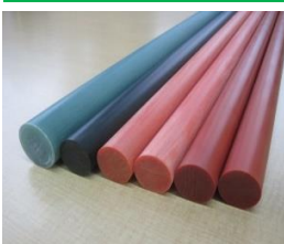
ベークライト丸棒

当技術により製造された製品(丸棒・パイプ・板)は、絶縁部品として用いられることが多く、発電分野等で多く活躍しております。特に、極厚板は既存のメーカーでも製作できないもので、当社のみの特有の技術です。今後も発電分野だけでなく、電車車両や電気自動車、航空宇宙産業などへの展開も期待されています。