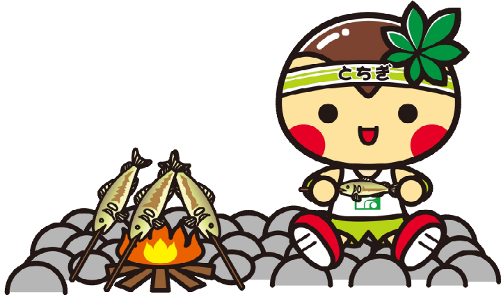
さくら市喜連川 鮎