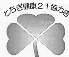
とちぎ健康21協力店のマーク

県民の皆さんが外食するときに、自分に合った食事を選択したり、栄養や食生活に関する適切な情報が得られるよう、栄養成分表示、ヘルシーメニューの提供、とちぎ健康づくり応援弁当の販売、健康情報発信、禁煙・分煙などに取り組む飲食店、スーパーマーケット、コンビニエンスストアなどを「とちぎ健康21協力店」として登録し、県民の健康づくりを支援しています。