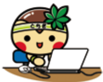
栃木県ホームページ

栃木県では食品表示に関する情報の他、食中毒の予防方法など食の安全・安心に関する情報発信を行っています。ご興味がある方は下の二次元コードからご覧ください。