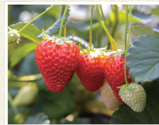
とちぎのいちご(栃木県)