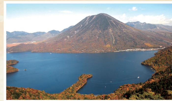
男体山と中禅寺湖(日光市)