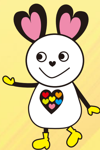
カルフォルとちぎ応援隊長 ナイチュウ

フランス語の“交差点”を意味する「carrefour/カルフル」から、障害の有無にかかわらず、たくさんの人が交流する場になるようにという願いをこめて。