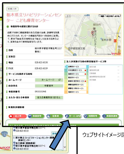
ウェブサイトイメージ図