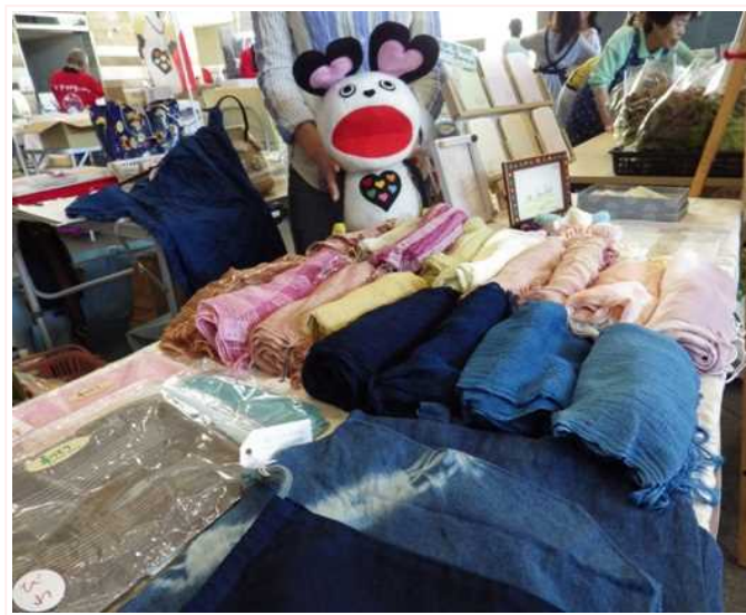
今回はぼくのグッズも販売♪

ナイチュウパン、プリントクッキー、缶バッジ、マグネット、デコパージュ石けんの5種類の商品を販売しました。