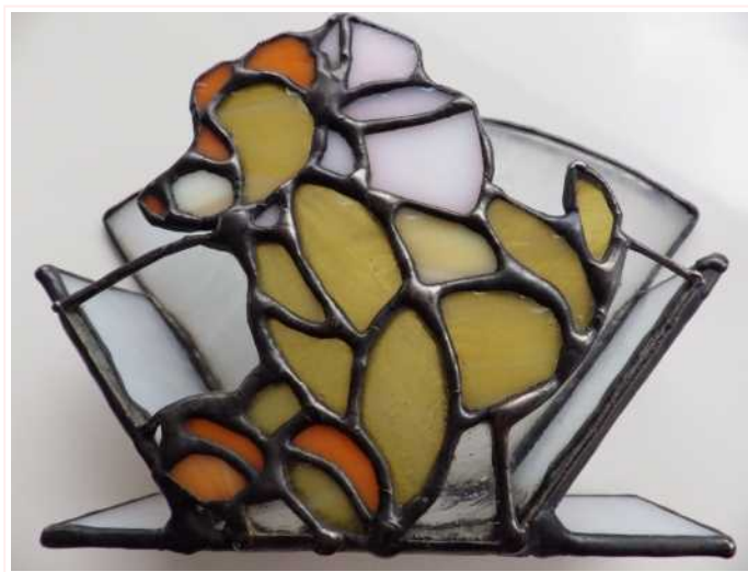
ペーパーフィルター用ホルダー